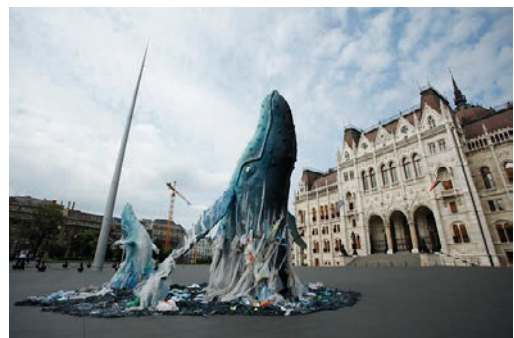
7. kép: A Greenpeace aktivistái műanyag hulladékból egy 3 és egy 6 méter magas bálnaszobrot állítottak fel az Országház előtt, ezzel felhívva figyelmet a műanyagszennyezés megakadályozásának fontosságára!