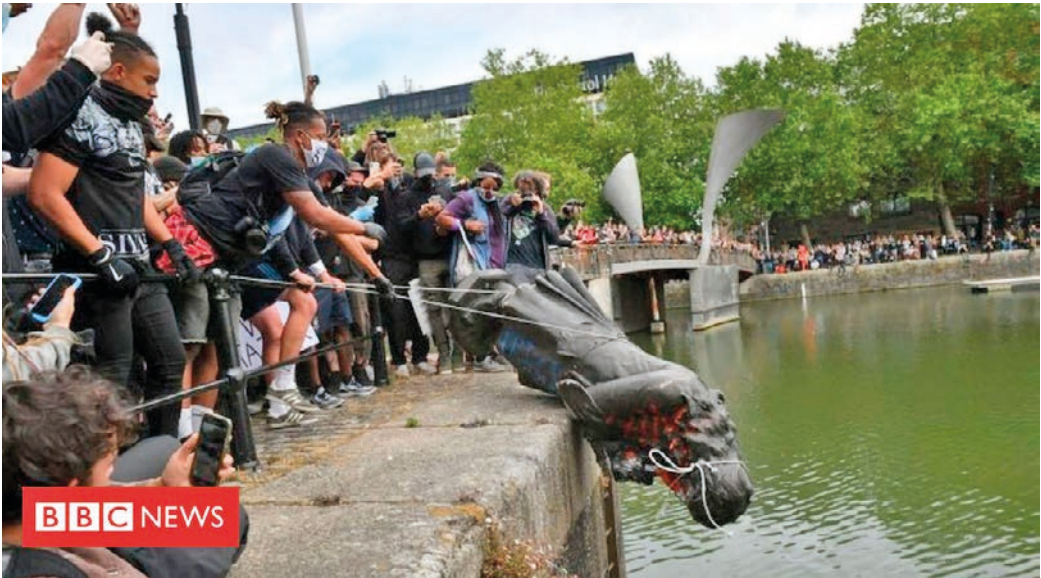
3. ábra Tüntetők egy csoportja a Temze folyóba dobja Edward Colston egykori rabszolगतartó szobrát