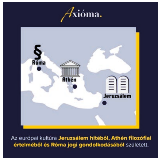
4. ábra

Amennyiben azt szeretnénk, hogy az Unió a jövőben is modern és felvilágosult közösség legyen, ahol a tagállamok a jogot és a racionalitást saját érdekeik és meggyőződésük előterébe helyezik, ezeket az alapértékeket meg kell védenünk a XXI. század kihívásaival szemben.