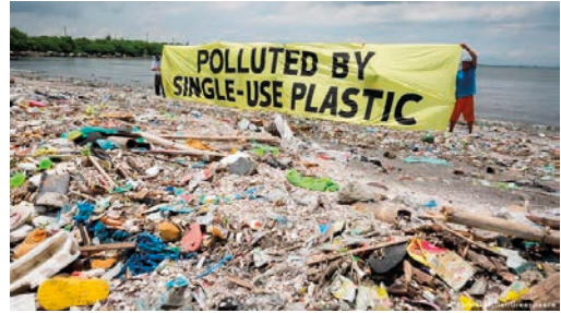
5. kép: A Greenpeace önkéntesei egy „Polluted by single-use plastic” (azaz, Egyszerhasználatos műanyag szennyezése”) feliratú molinóval igyekeznek felhívni erre a figyelmet, mielőtt megmenének Manila partjait ettől a tetemes mennyiségű hulladéktól.

Az óceánokban és tengerekben találhatóunk úgynevezett kézzel fogható műanyagdarabokat, amelyek a kisebb problémát jelentik a problémahalmazban, hiszen azok szemmel láthatóak és ki tudjuk ezeket halászni. Az egész napos napsugárzás, valamint az állandó sodródás hatására ezek a műanyagdarabok folyamatosan egyre kisebb darabokra bomlanak, addig, amíg mikro- és nanoműanyagokká nem válnak. Ezeknek a szemmel nem vagy alig látható műanyagoknak a hatásai az emberi és állati szervezetekre máig nem meghatározottak. Igaz, hogy a vízszűrőberendezések majdnem 90%-át ki tudják szűrni ezeknek a részecskéknél, azonban a többi megközelítőleg 10% az emberi szervezetbe jutva fejtheti ki közvetlen hatását. A műanyagok erős megkötőképességgel rendelkeznek, ezért összekapcsolódnak más szennyezőanyagokkal, például nehézfémekkel és ezekkel közösen fejtik ki káros hatásukat. Okozhatnak például születési rendellenességeket, fejlődési zavarokat vagy akár daganatot is. Évente megközelítőleg 50 ezer darab mikroműanyagot „fogyasztunk el”, azonban a rendszeres ásványvízfogyasztóknál ez a szám megközelítheti a 130 ezret is. Ezeknek az élettani hatásai még ismeretlenek az emberiség