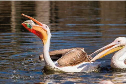
3. kép: Egy pelikán a csőrében a táplálékához társult műanyaggal. Hosszú távon ez a nagy mennyiségű műanyag a madarak pusztulásához vezethet.