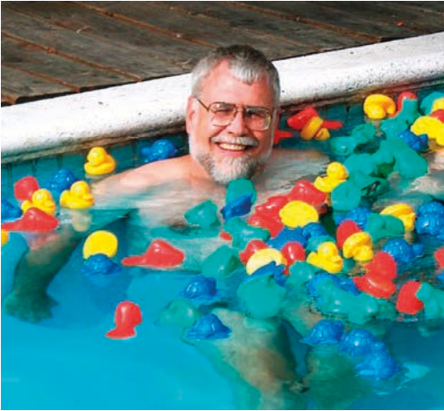
2. kép: Curtis Ebbesmeyer: kutató, aki egy társával kifejlesztett egy számítógépes modellt, amely a gumikacsák mozgásán keresztül vizsgálta az óceáni áramlatokat.