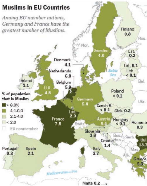
5. ábra Az Európában élő muszlimok elhelyezkedése. Jelenleg Franciaország és Bulgária vezetik a listát.

Among EU member nations, Germany and France have the greatest number of Muslims.