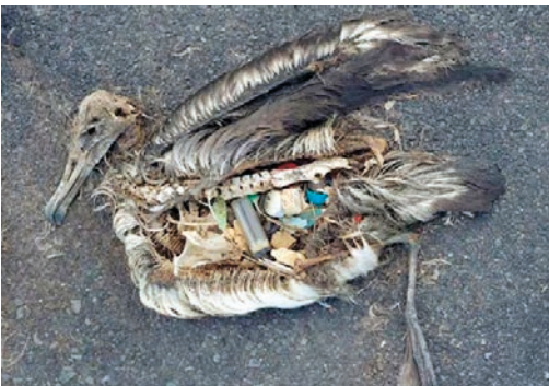
4. kép: Egy madár teteme és a pusztulását okozó temérdek műanyag hulladék.

az aszfalt közepén. Természetesen ez is óriási gond, de a kolosszális baj azzal van, ahová és ahogyan, vagy ahogyan nem kerül el a sok-sok szemét.