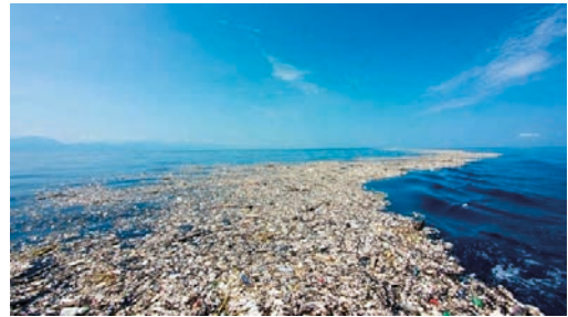
6. kép: A Kalifornia partjainál található, 1,6 millió négyzetkilométer területű szemétsziget.